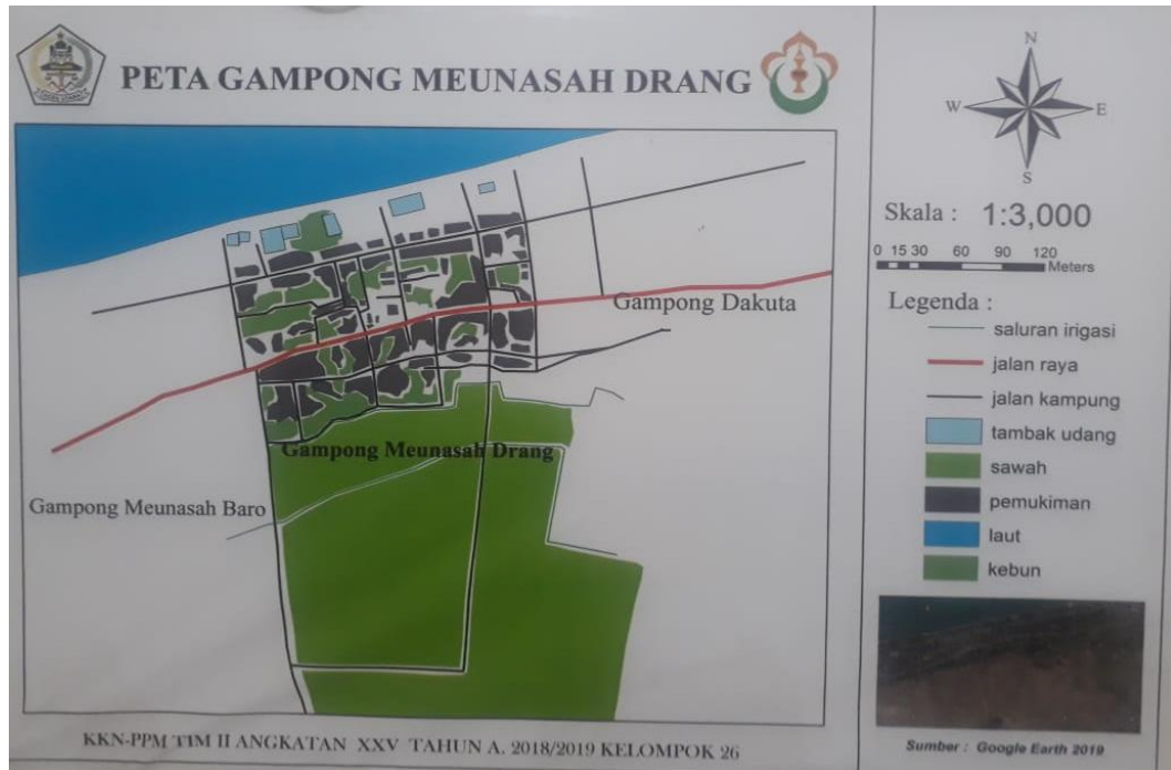
Lampiran 1. Peta Gampong Meunasah Drang, kecamatan Muara Batu, kabupaten Aceh Utara.