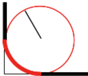
Rounded using an arc of circle