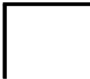
No rounded corner

Kurva setiap sudut didefinisikan menggunakan satu atau dua jari-jari, Mendefinisikan bentuknya: lingkaran atau elips.