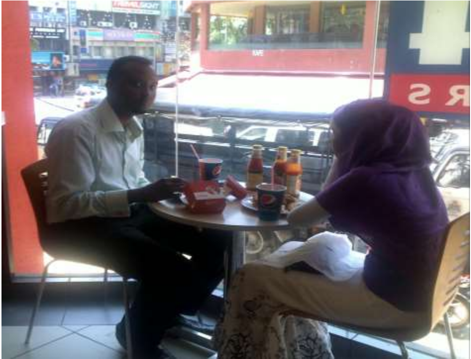
Figure 1 Suasana tempat makan di KFC Bukit Bintang, Kuala Lumpur, Malaysia.

dipesan. Hal ini yang telah menjadi salah satu trend masyarakat modern sekarang, sehingga kedai McDonald dan KFC dipenuhi setiap saat oleh pengunjung.