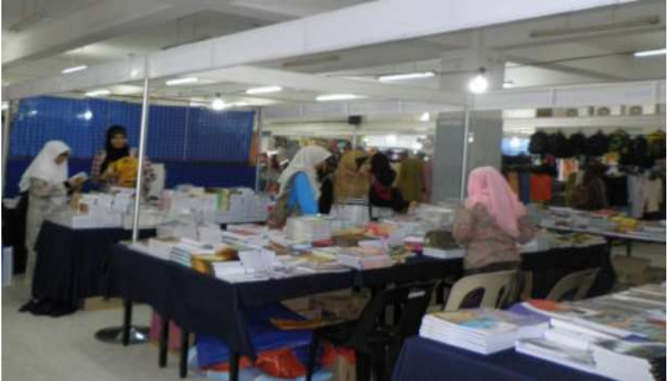
Figure 3 Aktifitas niaga di bangunan pusanika kampus induk UKM Bangi Malaysia, untuk menumbuhkan semangat keusahawanan di kalangan mahasiswa.

peluang-peluang yang tidak disadari oleh orang lain. Usahawan akan mengambil tindakan secara imajinatif, kreatif dan inovatif. Sedangkan Shefsky (1994) mendefinisikan usahawan sebagai seorang yang masuk ke alam perniagaan tidak kira dalam bentuk apapun perniagaan dan pada masa yang sama bersaing untuk terus mengukuhkan lagi perniagaan yang dijalankan.