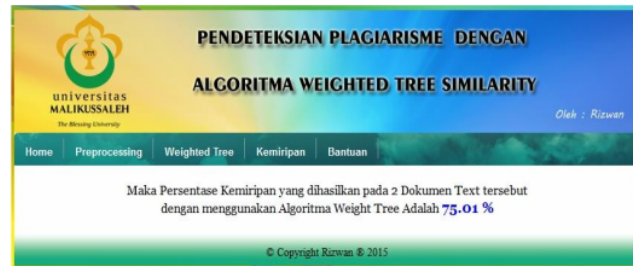
Gambar 7. Menu hasil kemiripan

Form hasil persentase kemiripan yang dihasilkan pada 2 dokumen Text tersebut dengan menggunakan Cosine Similarity merupakan form untuk melakukan presentase kemiripan yang akan dihasilkan oleh dua buah dokumen text. Berikut tampilan hasil kemiripannya.