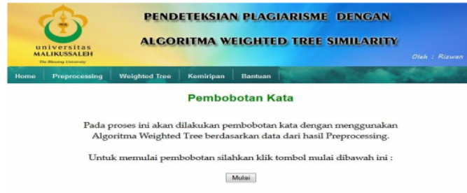
Gambar 5. Halaman algoritma weighted tree

Form hasil weighted tree merupakan form untuk melakukan pembobotan kata dengan algoritma weighted tree berdasarkan data dari hasil preprocessing. Berikut ini tampilan algoritma weighted tree .