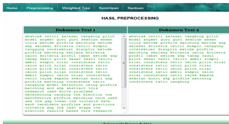
Gambar 4. Menu hasil halaman preprocessing

Form menu preprocessing merupakan tahap dokumen text yang diinput sehingga hanya kata dasar saja yang akan diambil untuk proses weighted tree , berikut ini tampilan form hasil preprocessing.