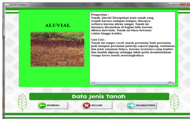
Gambar 3. Tampilan data jenis tanah

Tampilan ini merupakan menu nilai hasil tahap akhir dari seluruh jenis tanah yang sudah diseleksi menggunakan metode SAW, dengan tampilan seperti pada Gambar 5.