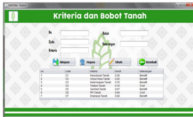
Gambar 4. Tampilan data kriteria dan bobot