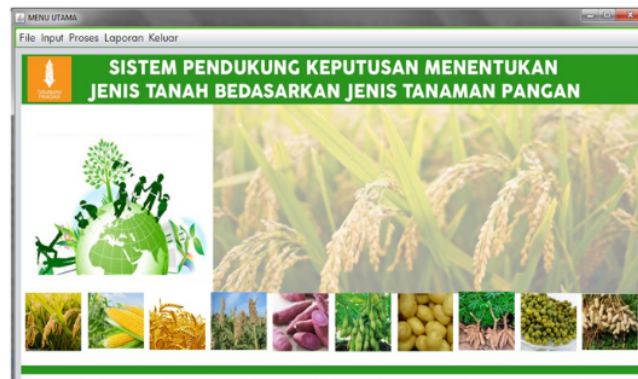
Gambar 2. Tampilan menu utama