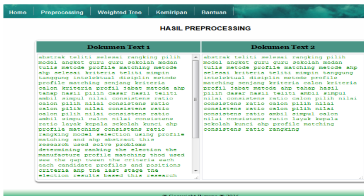
Gambar 4. Menu hasil halaman preprocessing

Form menu preprocessing merupakan tahap dokumen text yang diinput sehingga hanya kata dasar saja yang akan diambil untuk proses weighted tree , berikut ini tampilan form hasil preprocessing.