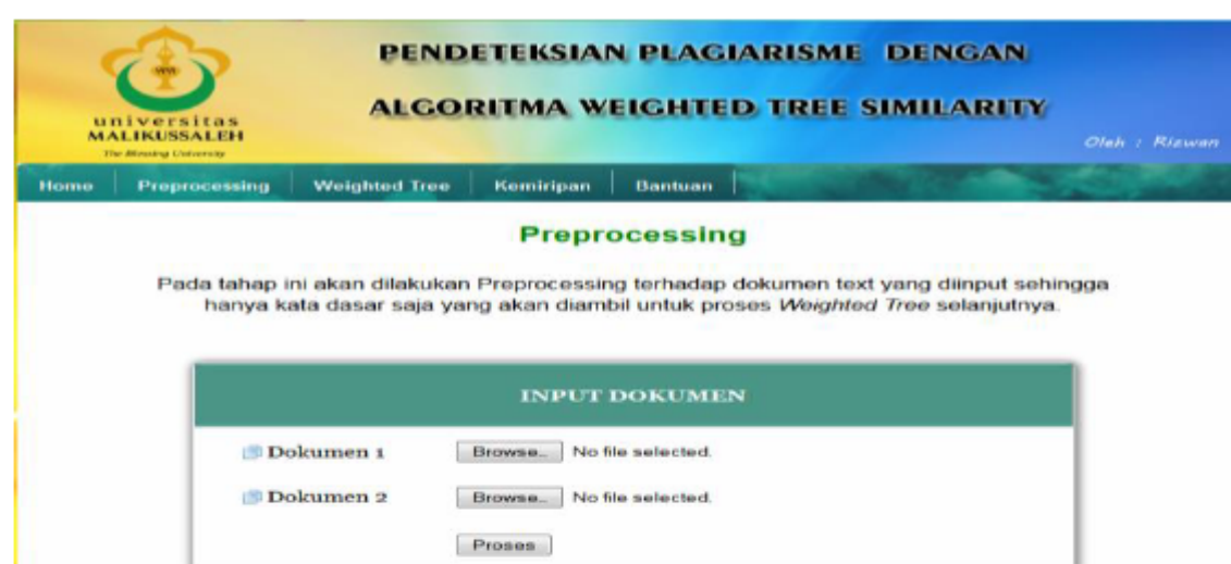
Gambar 3. Menu halaman preprocessing

Form menu preprocessing merupakan tahap dokumen text yang diinput sehingga hanya kata dasar saja yang akan diambil untuk proses weighted tree , berikut ini tampilan form preprocessing untuk halaman user.