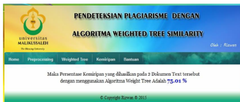
Gambar 7. Menu hasil kemiripan

Form hasil persentase kemiripan yang dihasilkan pada 2 dokumen Text tersebut dengan menggunakan Cosine Similarity merupakan form untuk melakukan presentase kemiripan yang akan dihasilkan oleh dua buah dokumen text. Berikut tampilan hasil kemiripannya.