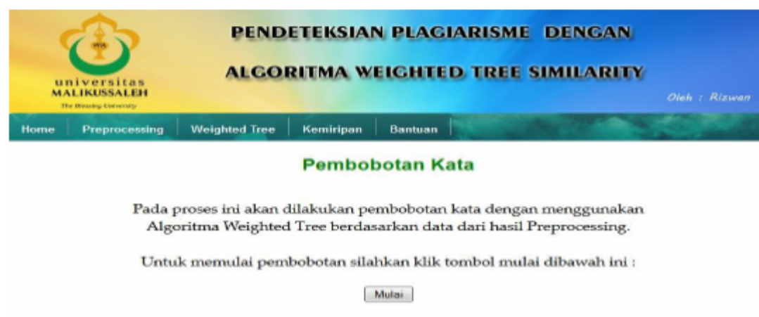
Gambar 5. Halaman algoritma weighted tree

Form hasil weighted tree merupakan form untuk melakukan pembobotan kata dengan algoritma weighted tree berdasarkan data dari hasil preprocessing. Berikut ini tampilan algoritma weighted tree .